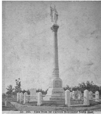
図版7 実際のカーヴァーの碑 (Wikipedia "Hartwell Carver"より)