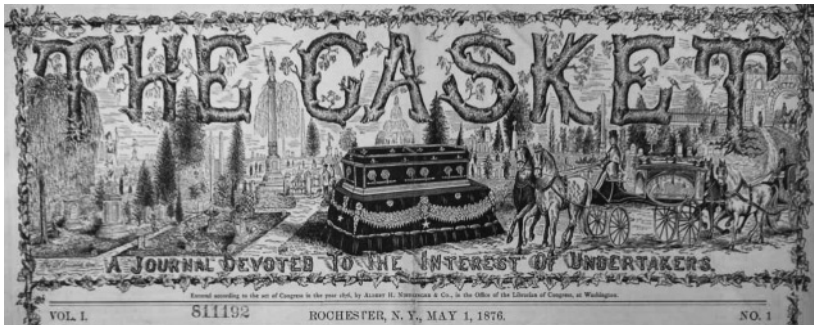
図版3 『キャスケット』誌創刊号のタイトルのデザイン ( The Casket , May 1, 1876より)

次に、『キャスケット』誌に焦点を当てた考察に移りたい。今回の調査でもっとも重要な発見と筆者が考えるのは、『キャスケット』誌の初年度(2冊)と2年目に使われたタイトル・デザインの解釈である。創刊年と次年度に使われた図案(図版3)は、スペースを多くとり、人目を引く凝ったエングレイビングである。墓園風景を葬儀雑誌のデザインに取り入れることは、『シュラウド』誌や『アンダーテイカー』誌にも見られる 53) 。それはエジプトやギリシャの風景であつたり(『サニーサイド』誌1913年