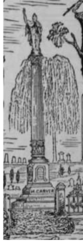
図版6 絵の中のカーヴァーの碑 ( The Casket , May 1, 1876より)