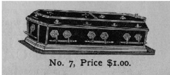
図版5 図版4と同じ図案の印刷用エレクトロタイプ ( The Casket Business Directory , Dec.25, 1886より)

な世界というよりも、有機的、物語的、女性的ですらある。なぜ、そのような雰囲気が生まれるのか、筆者が考える理由を2つあげたい。