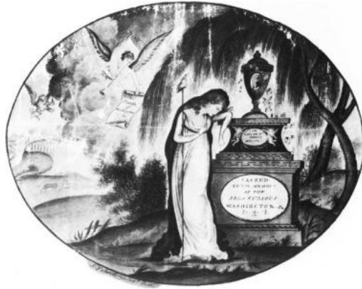
図版2 サミュエル・フォルウェルのワシントンの死を悼む追悼画。 Philadelphia, ca. 1800. Paint on silk (Anita Schorsch, “A Key to the Kingdom” より)

がきっかけとなった。ワシントンの死を悼んで国中が喪に服し、ワシントンの死を称揚する哀歌や絵、陶磁器（イギリス製）が大量に生産された。ワシントンの追悼画でもっとも普及した絵は、サミュエル・フォルウェル（Samuel Folwell, 1764-1813）のものである（図版2）。リバティ・キャップをもったアメリカがワシントンの墓にうなだれ、国父の死を嘆いている。右側には、墓を覆う柳の木が描かれている。図版3は、フォルウェルの絵を真似た追悼画で柳はさらに大きく垂れ込め、左側には独立戦争で負傷した兵士がワシントンの死を悲しんでいる。国父の死がきっかけとなり、ワシントンの追悼画が流行するが、すぐにこの英雄に代わって、身近な家族の死を悼むよりプライベートな追悼画が数多く制作されるようになった。それらの絵には必ずと言ってよいほど、柳の木が描かれている。時として賑やかな港町が遠景に描かれる時もあるが、ほとんどは牧歌的な風景のなかに、墓と柳と追悼者たちが描かれる（図版4）。