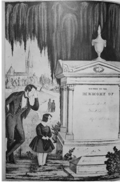
図版5 印刷された追悼画“Sacred to the Memory of 1847.” N. Currier. ( A Time to Mourn より)

ように、追悼画も姿を消し始める。印刷の追悼画が大量に現れ始めたこともその衰退の原因である（図版5）。