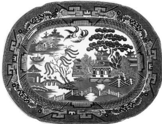
図版6 スタANDARDなウィロー・パターンの大皿。ストーンウェアにブルーの転写プリント。19世紀半ば。 ( The Illustrated Encyclopedia of British Willow Ware を参考)

柳のイコノグラフィを考える上で重要なもうひとつの柳の熱狂現象を見てみたい。ブルー・ウィロー陶磁器の製造と普及である(図版6)。ドレイパーが指摘するようにシノワズリの流行から生まれたブルー・ウィロー陶磁器の人気の、柳の木のシンボリズムに何らかの影響を与えたことは確かだろう。しかし、ブルー・ウィロー物語に、死との連想はあるものの(物語の最後に二人とも死んで2羽の鳥になる)、新たに柳が獲得した追悼・葬送のシンボリズムと関わるというよりも、18世紀に消失した—とドレイ