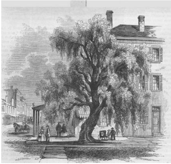
図版1 ゲイツ將軍のマンハッタン私邸、ローズ・ヒルの柳。 ( Harper's New Monthly Magazine , Vol. 24, 1862より)

事実をあげてこれを否定している。独立革命以前に、アメリカに生えている柳について書かれているものに著者の知る限り出会ったことはないのだから、カステイスの話は真実と考えてよいだろうと結論づけている。イギリスとアメリカの柳はすべて、英語文化が生み出したたぐい稀な天才ポーズを讀めるべく美しく、詩的な生きる記念碑であるとしめくくられている。 22)