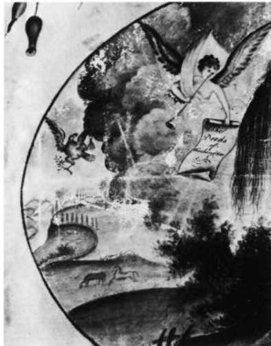
図版9 図版2の細部。空には天使と白頭ワシが飛んでいる。

ウィロー・パターンには、鳥が描かれているが、追悼画ではどうだろうか。ウィロー・パターンの鳥は、物語によると（とは言え、絵柄が先に存在したのだが）、悲劇的な死を迎えた二人のカップルが神々の情けで鳥となり、永遠の命を授かった姿を表している。追悼画でも空に何か描かれていないか捜すと、翼をもった天使がまず目につく。その一つ、1810年頃に制作されたアレグザンダー・ハミルトンの死と、それより数年まえに亡くなったワシントンを悼んだ追悼画には、翼をもった二人の天使が右上に浮かんでいる。若い国家が失った二人のリーダーを天国に導く天使たちである。 45) 先のフォルエルのワシントンの追悼画には、左上には翼をもった