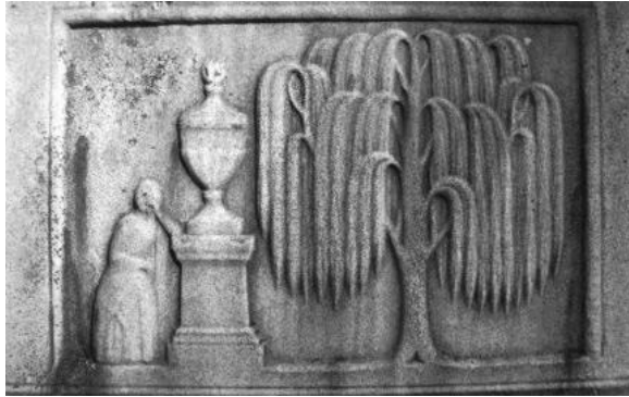
図版7 墓に彫られた柳. 柳の枝が数本房になっている。

「バンケットルーム」と呼ばれている), 二羽の鳥, 前景の庭のフェンスなどである。 42)