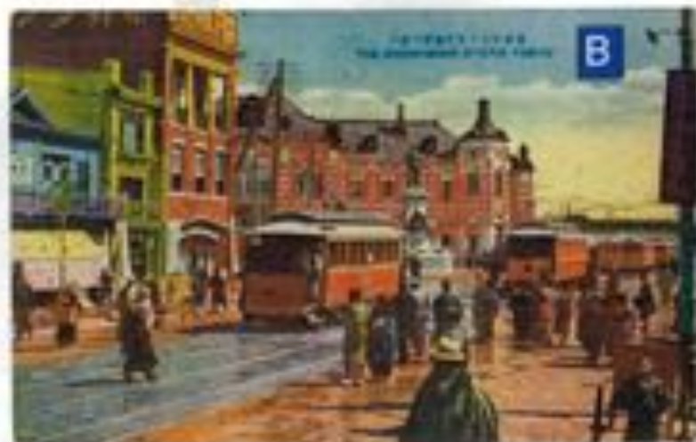
A/B/Cとも震災から復興期