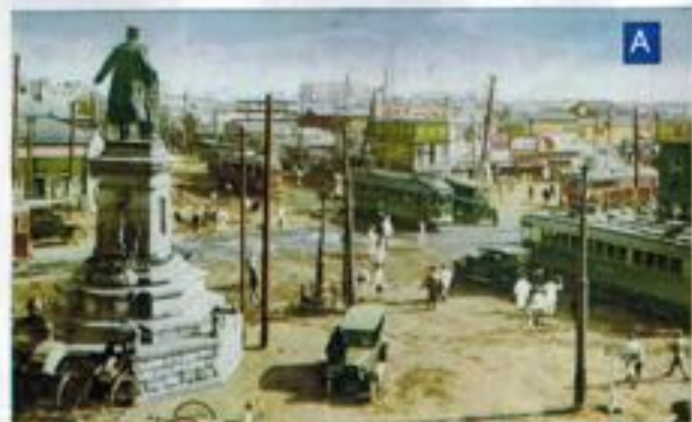
The bronze statue of the emperor Meiji, Kyoto, (1900 Tokyo) 皇太子御即位の御慶典 (1900)