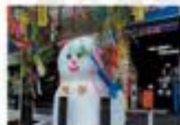
神田雪だるまフェア