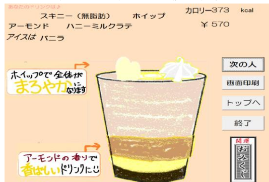
図3 ドリンク詳細画面