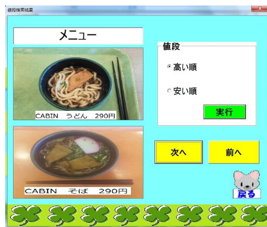
図2 予算検索結果画面