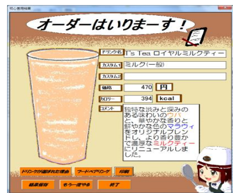
図3 ドリンク解説画面

(2) ドリンク解説画面では静止画像しか使用していないので、動画像を使用するなど工夫して、さらに理解を深められるように改善したい。