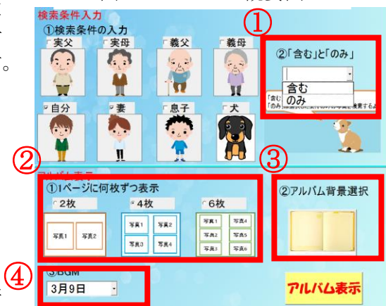
図1 システム概要図