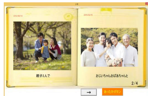
図3 アルバム表示画面