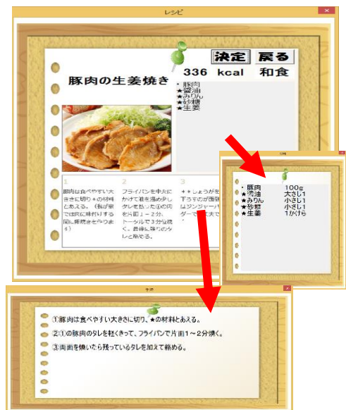
図3 レシピ表示画面