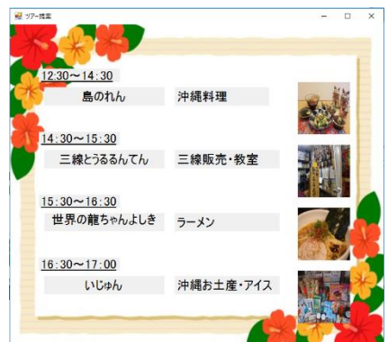
図3 ツアー提案画面