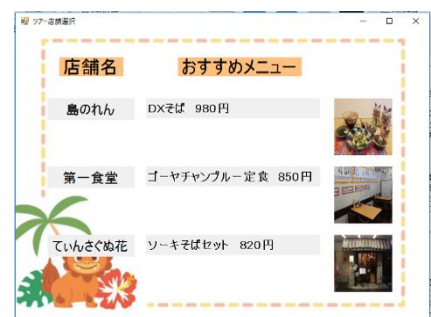
図2 ツアー診断結果画面